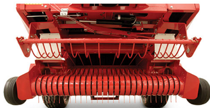
Pick-up 2,0 mt standard