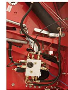
Válvula de calibrado instalacion hidraulica Calibration valve of hydraulic installation