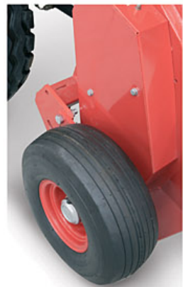
Ruedas de goma equipo standard Rubber wheels standard equipment