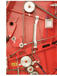
Lubricación automática Automatic lubrication