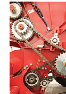
Seguridad sobre alimentador Safety on comb-feeder