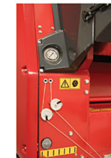
Atador doble hilo con indicador exterior de posición Double twine binder with outside indication of position