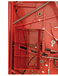
Porta rollos hilo Holder of twine reel