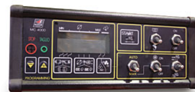
Central electronica Electronic switch board