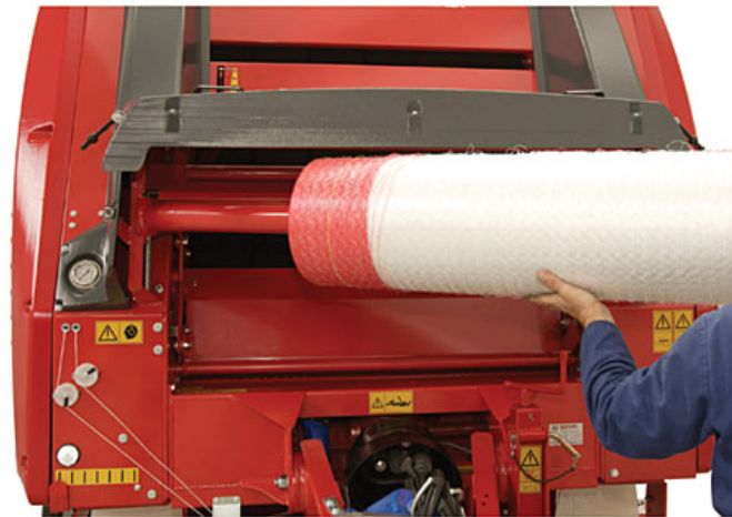
Montaje rollo malla Installation net reel