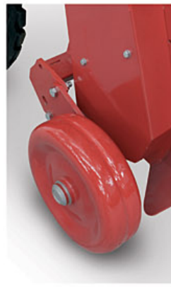
Ruedas de hierro opcional Iron wheels optional