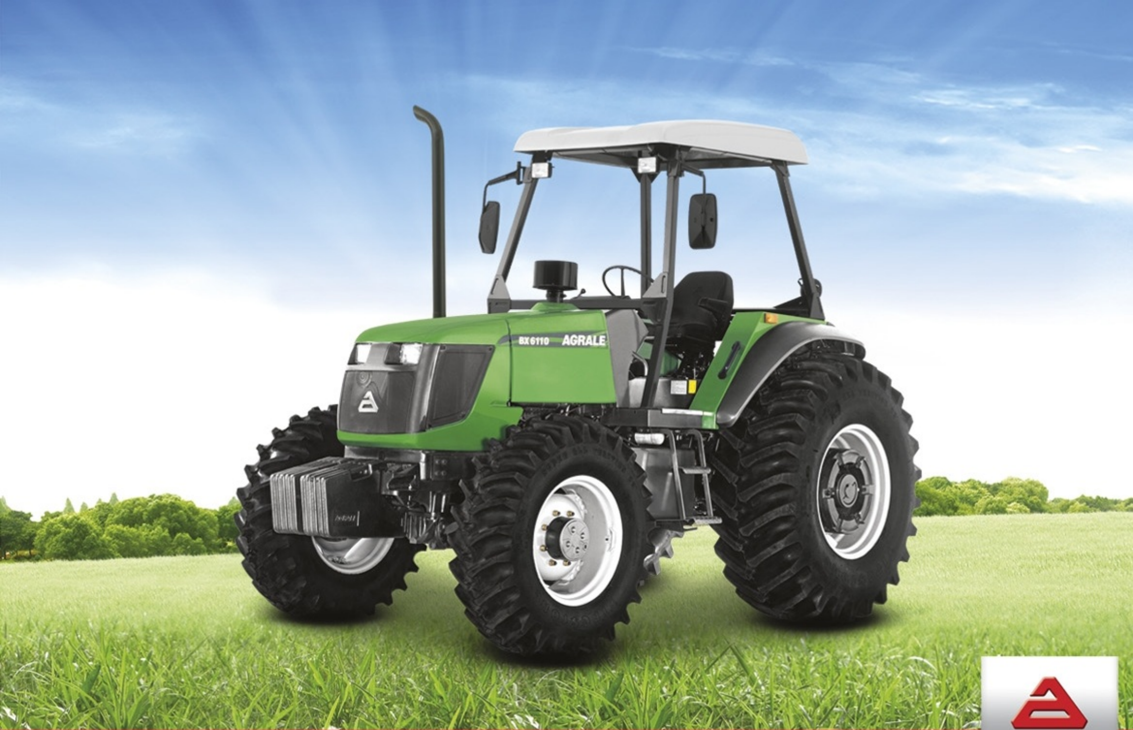
Trator BX 6110