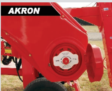
TRANSMISIÓN DE ROLO MEDIANTE ROBUSTA CAJA REDUCTORA Y 1 SOLA CADENA.