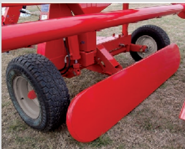
ACELERADOR DE CARGA. ASEGURA ÓPTIMO FINAL DE BOLSA.