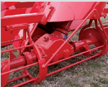
CAJA ANGULAR INFERIOR