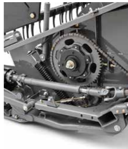
Accionamiento de la caja de navajas por cardán