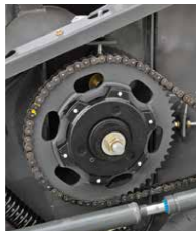
Embrague de seguridad del caracol