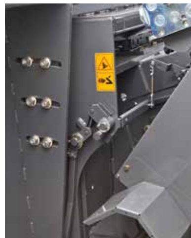
Regulación longitudinal del conjunto plataforma

Es la familia de plataformas con el menor número de componentes, así como con el menor peso del mercado.