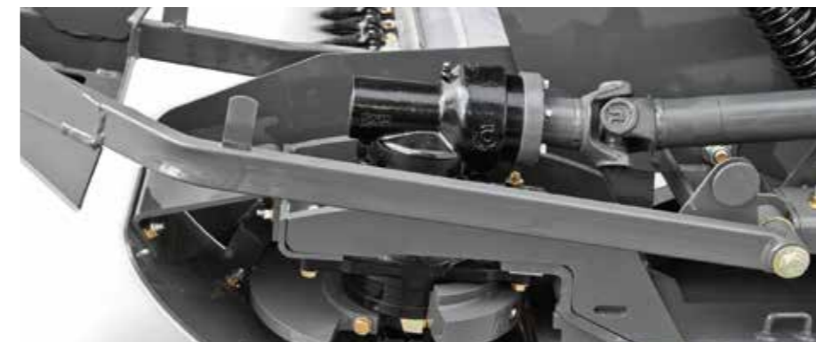
Caja de cuchillas con balanceo dinámico