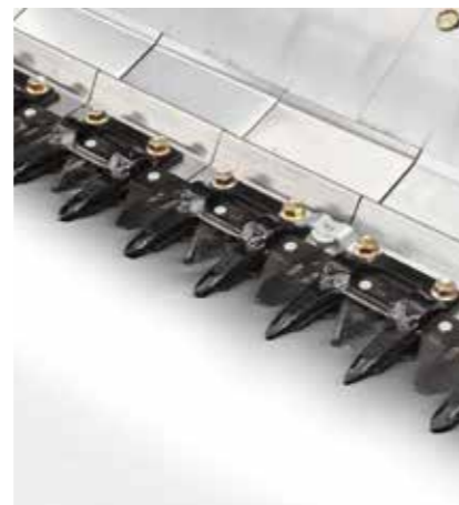
Sistema de corte Schumacher