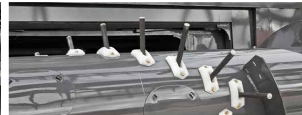
Dedos retráctiles del caracol