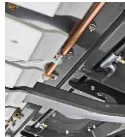
Bloqueo del conjunto flexible