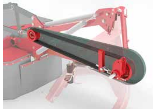
Amortiguador de golpes.