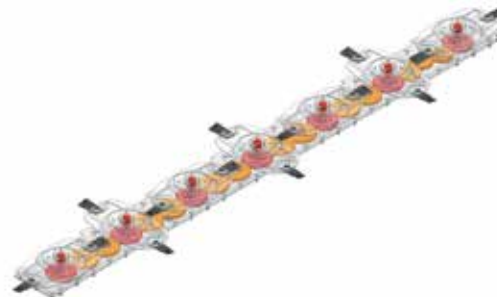
Barra de corte bañada en aceite – mayor durabilidad.