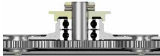
Montaje sólido del cojinete – altos niveles de confiabilidad en el uso.